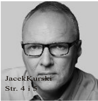
Jacek Kurski Str. 4 i 5